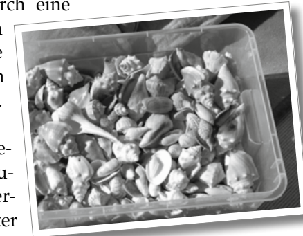
Eins, zwei, drei – veeeeel!

füllte Kästen, deren Inhalt gern gezählt oder sortiert wird.