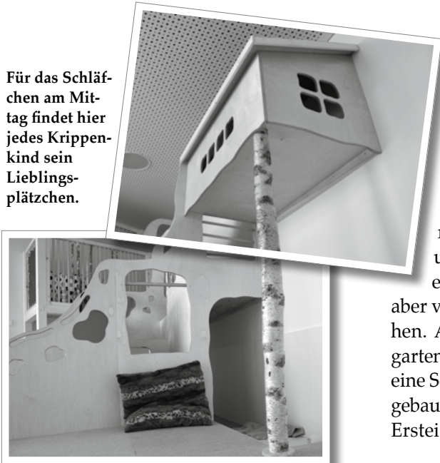
Für das Schläf- chen am Mit- tag findet hier jedes Krippen- kind sein Lieblings- plätzchen.

schiefe Aufgänge bis hinauf zu einem Baumhaus fast unter der Decke. Erstaun- licherweise kehrt über Mittag trotz der interessanten Umgebung Ruhe ein.